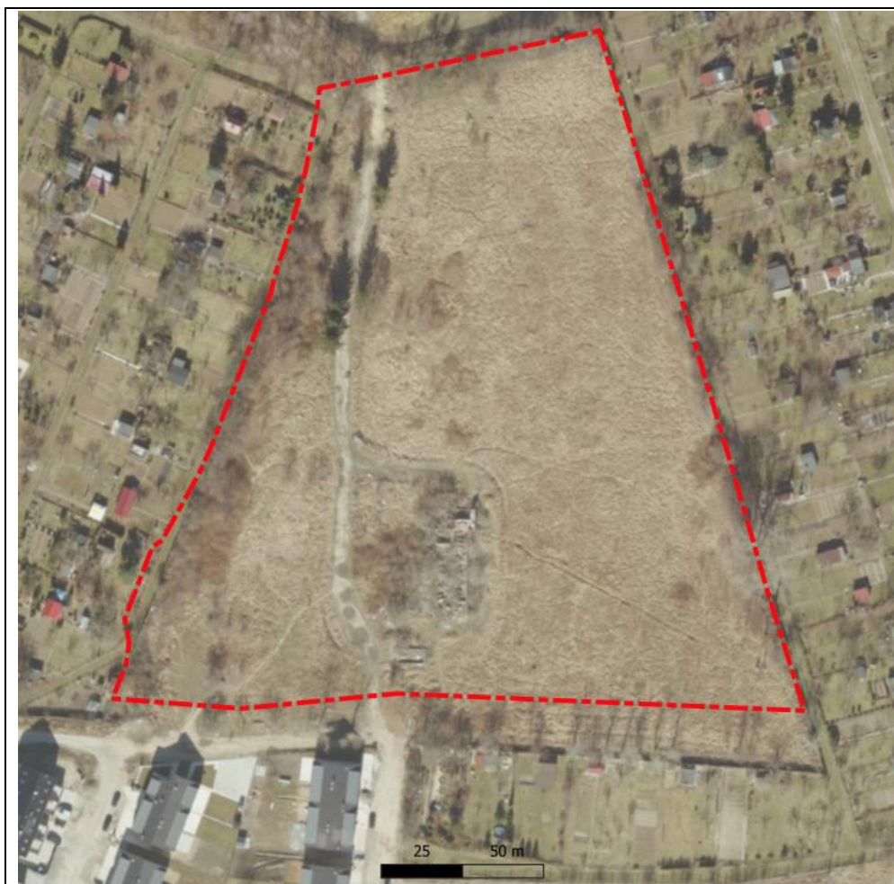
Ryc. 2. Granice terenu opracowania na tle ortofotomapy.